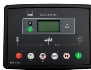
Controlador DEEPSEA 8610