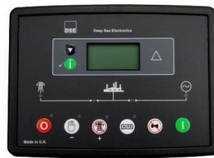
Controlador DEEPSEA 6120