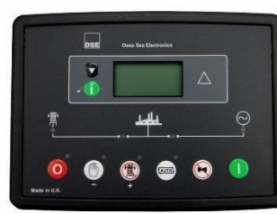
Controlador DEEPSEA 6120